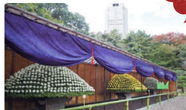
皇室ゆかりの伝統を受け継ぐ菊花壇展